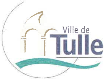
Schéma communal de défense extérieure contre l'incendie