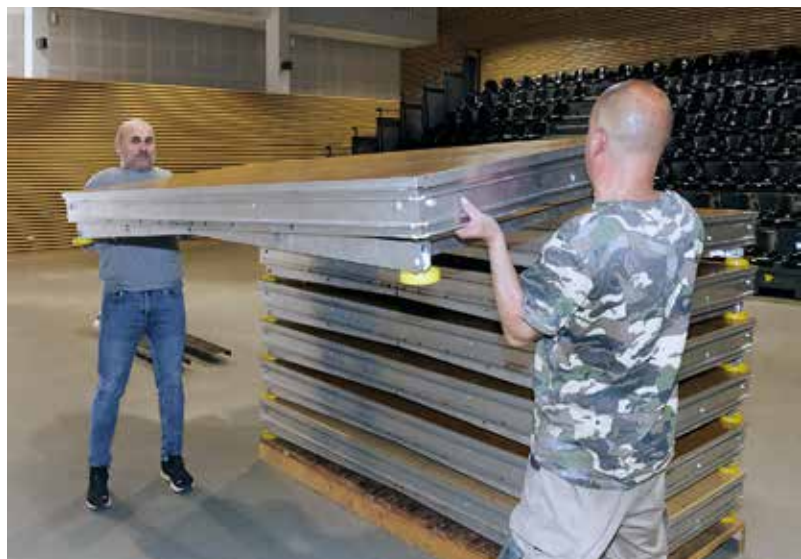
Le montage de la scène de 70m 2 , l'installation des chaises, l'utilisation du gril sont des options payantes pour la location de la salle.