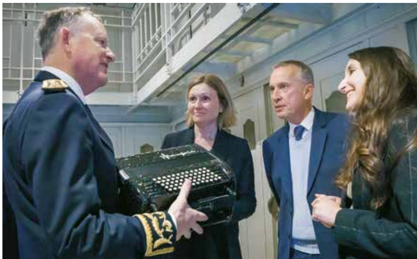
○ Yaël Braun-Pivet, présidente de l'Assemblée nationale, a découvert la Cité de l'accordéon et des patrimoines lors d'un déplacement officiel le 8 novembre dernier.