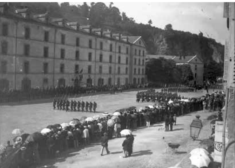
● Défilé militaire sur le Champ de Mars en 1896